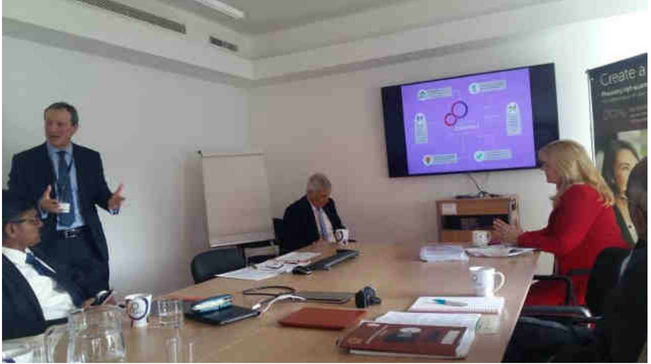
සමාරම්භක වැඩසටහන - Career Connect - UK