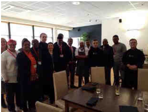
City of Liver Pool College