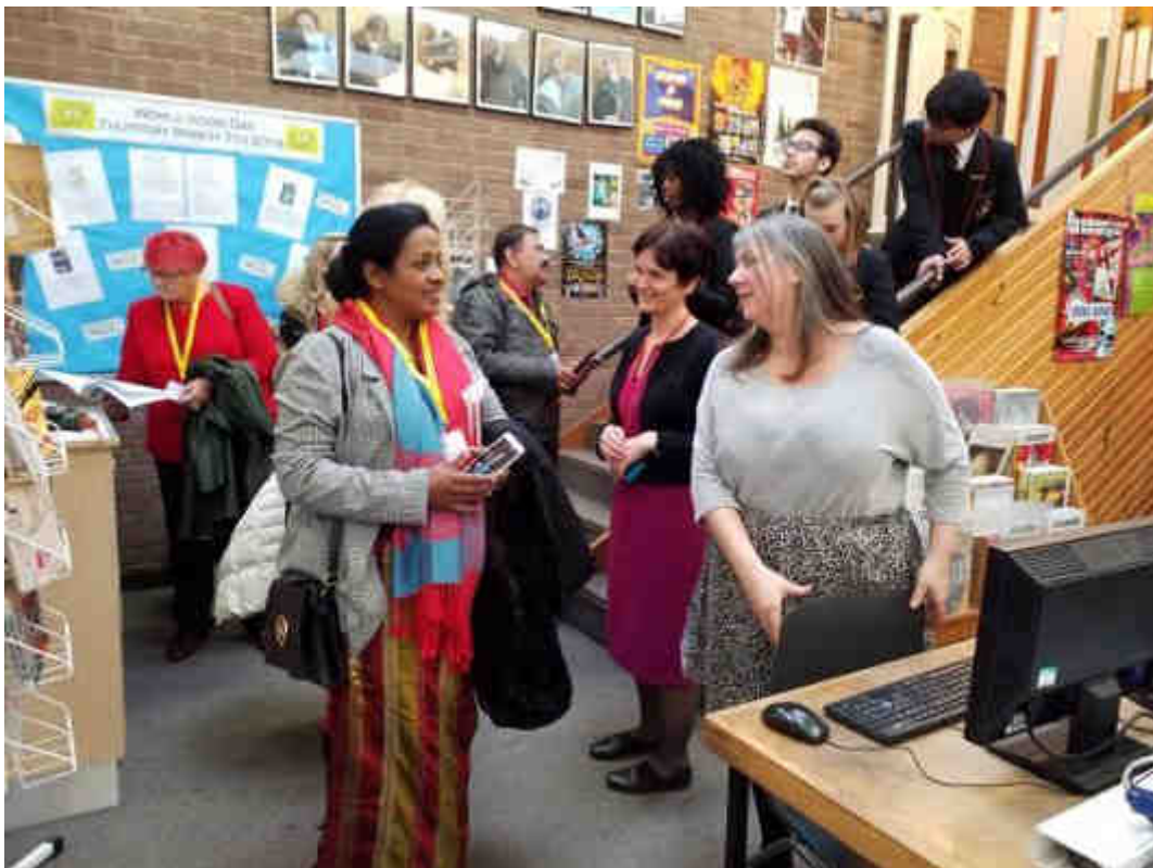
වෘත්තීය මාර්ගෝපදේශක සමග සාකච්ඡා කිරීම - Liverpool Collage