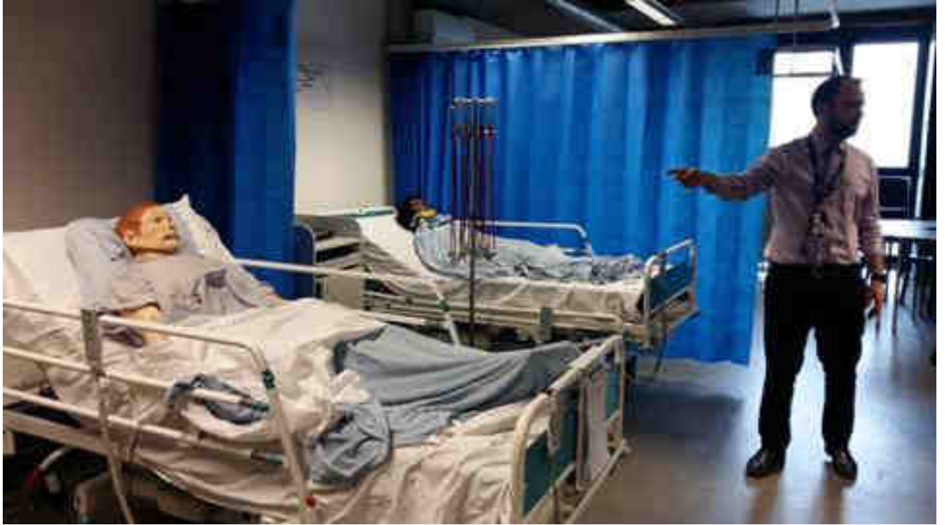
Liverpool Life Sciences University Technical College