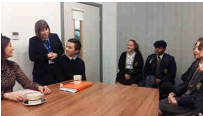
Notre Dame Catholic College